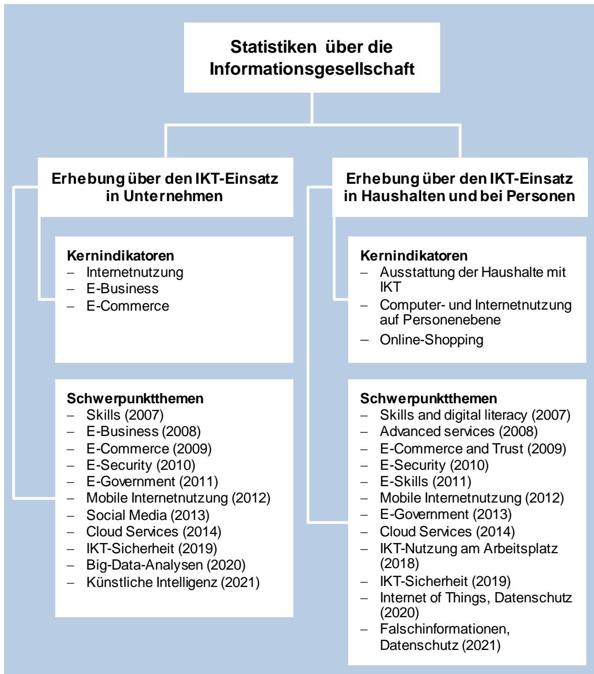
Abbildung 1: Überblick über die Statistiken über die Informationsgesellschaft

noch nach ÖNACE 2008 verfügbar. Um eine Vergleichbarkeit der Daten mit früheren Erhebungen zu gewährleisten, wurde für ausgewählte Indikatoren auf Basis eines Mikroansatzes („Micro approach“) eine Rückrechnung („Backcasting“) für die ÖNACE 2008 bis zum Erhebungsjahr 2003 durchgeführt.